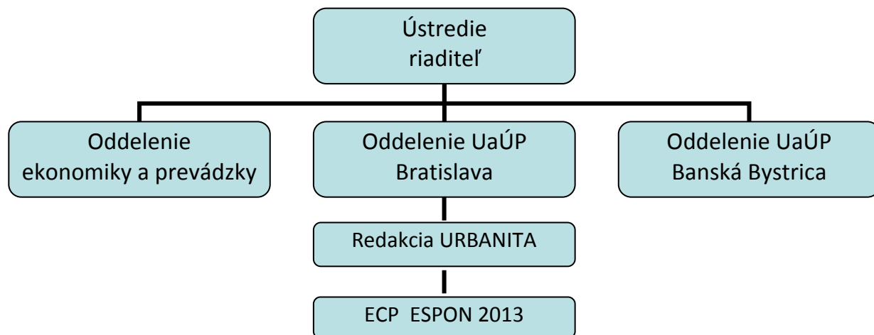
Schéma organizačnej štruktúry URBION-u:

Všetci zamestnanci majú vysokoškolské vzdelanie druhého stupňa. Prevláda profesia architekt – urbanista.